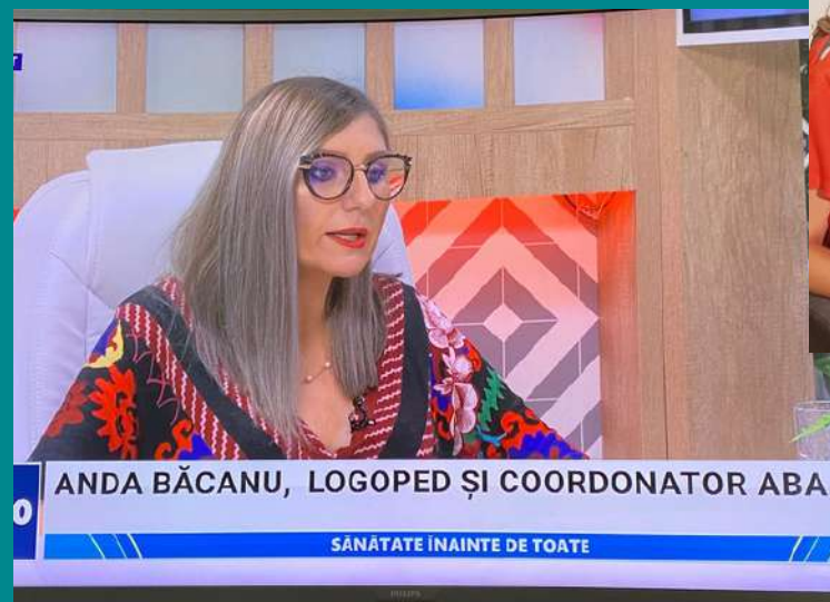
„Sănătate înainte de toate” Etno TV