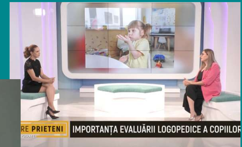
„Între prieteni” Metropola TV