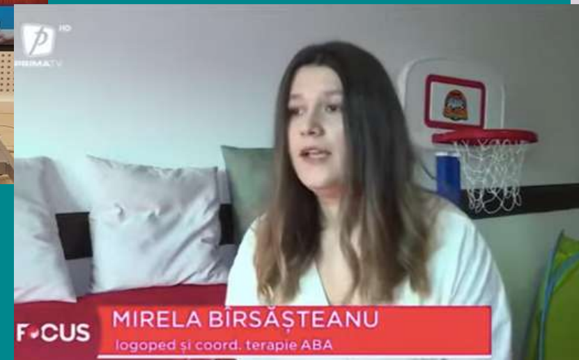
„Focus” Prima TV